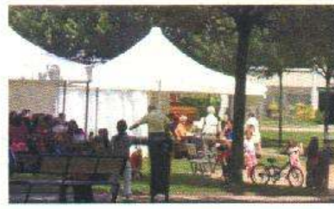
Picnic sur la place du village le 3 juin 2007 en toute convivialité